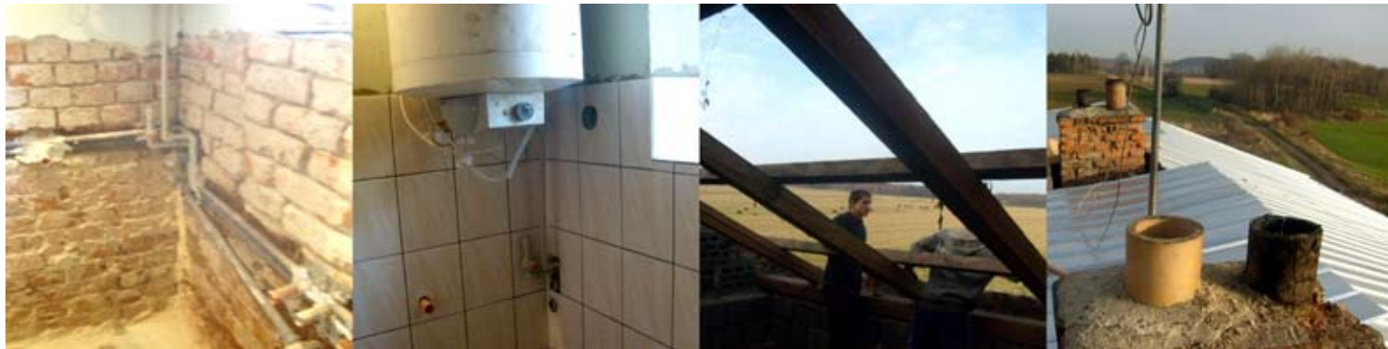
...rekonstrukce objektů Kobylá nad Vidnávkou, Velké Kunětic

Terénní pracovníci měli po dohodě s Agenturou pro sociální začleňování, která zde aktivně působí, na starost převážně klienty dvou problémových domů v Kobylé nad Vidnávkou a klienty z Velkých Kunětic. Podařilo se udělat velký kus práce, zlepšení v lokalitách lze vidět také na vlastní oči: díky koordinační práci a trpělivosti terénních pracovníků SRNM, finanční výpomoci firmy Campa Net a vlastní péči obyvatel se domy opravují a podmínky pro bydlení se pomalu ale jistě stávají přijatelnými.