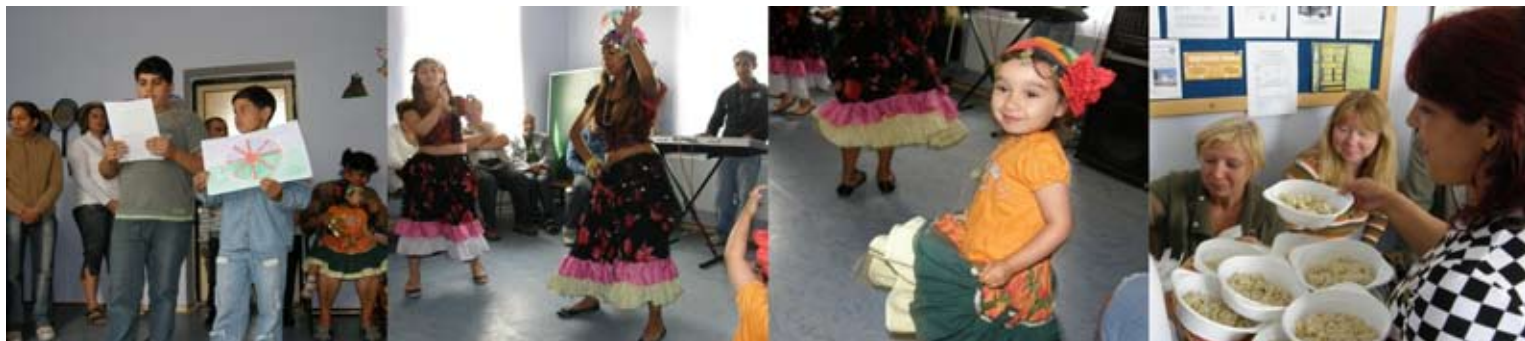
...den otevřených dveří Rýmařov

Aktivita v Moravském Berouně se rozjížděla jako nový kroužek. Jedná se o velice problematickou lokalitu, ve které začaly pomáhající organizace působit až v loňském roce. Po dohodě s dalším sdržením a vlastníkem objektu – místní základní školou jsme usoudili, že by bylo lepší, kdyby se aktivity jednotlivých organizací nekřížily a lektori byli přesunuti do obce Pěččín taktéž