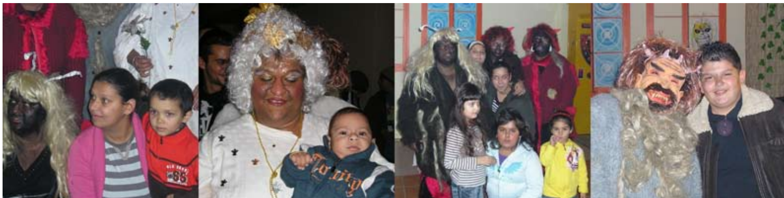
...Mikulášská besídka Hodonín