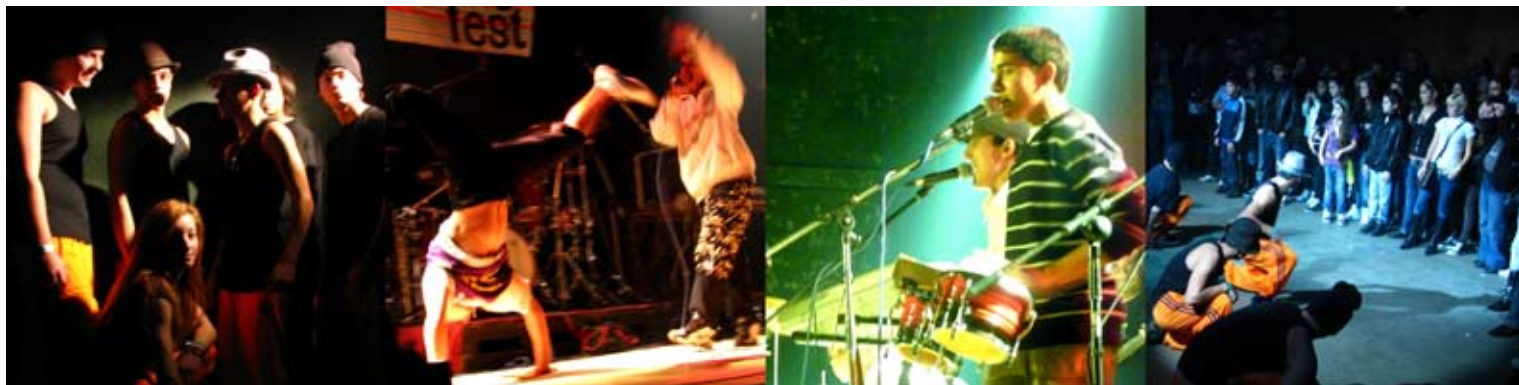
...soutěž Street Sounds

Na jaře jsme rozjeli druhý ročník soutěže mladých hudebních a tanečních talentů. Soutěžící se mohli opět hlásit buď osobně v kanceláři v Brně nebo prostřednictvím internetu.