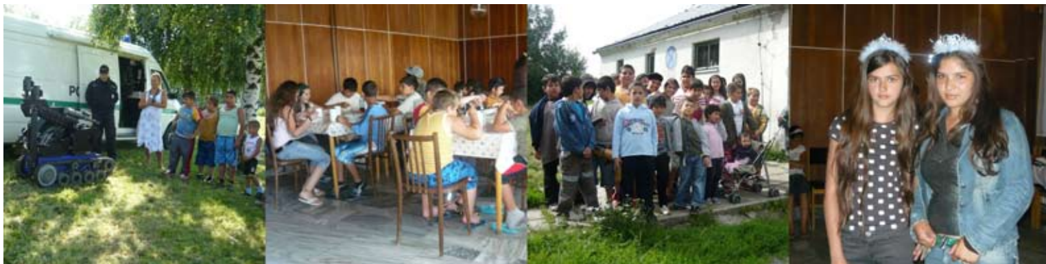
...tábor Olomouc - Pohořany

V roce 2009 jsme navázali úspěšnou spolupráci s Úřadem práce v Olomouci, Hodoníně a Prostějově. Příspěvky na veřejně prospěšné práce a společensky účelná pracovní místa nám umožnily zaměstnat správce několika komunitních center, komunitní pracovníky a terénní pracovníky. SRNM o.p.s. bylo obdobně podpořeno úřadem práce v Bruntále.